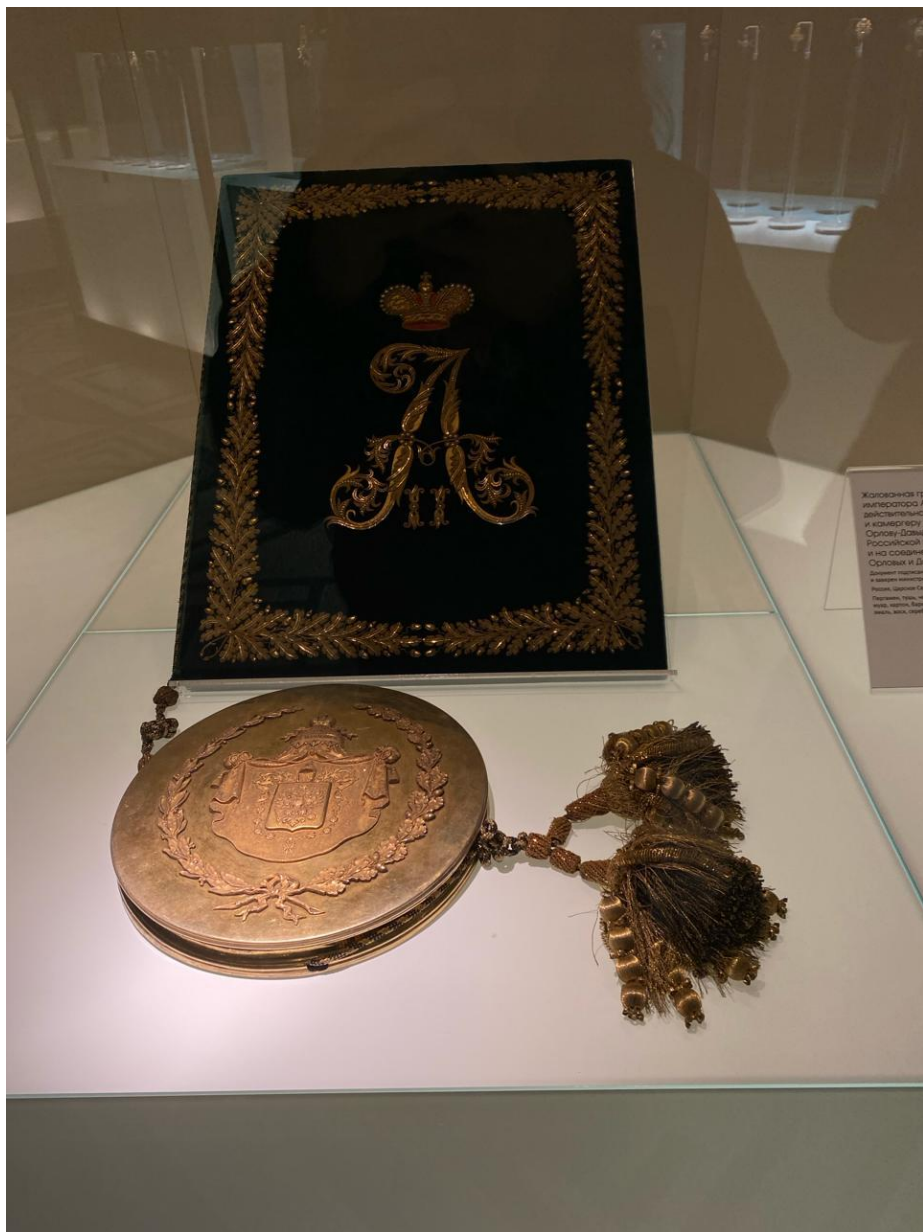
Жеманная гр императора А и императрицы Српий (Дана Российской и на содвине Српий и др. Делает маршал и другие России, Српий, Бе Литовии, Поль и др., 1812, 1813, 1814, 1815, 1816